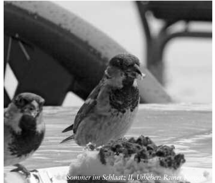
Sommer im Schlaatz II, Urheber: Rainer Kunsch