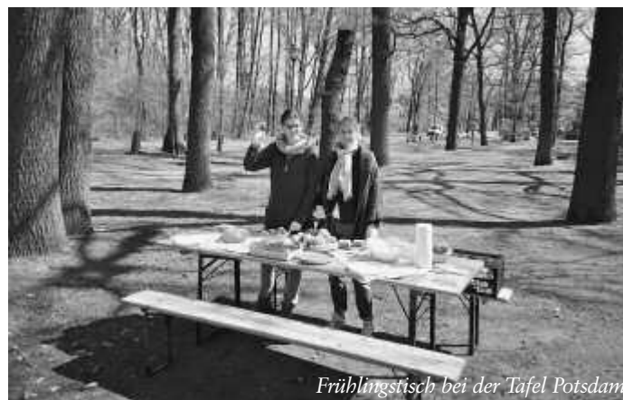
Frühlingstisch bei der Tafel Potsdam

Aktuelle Informationen und Terminänderungen unter: www.schlaatz.de und www.grubiso.potsdam.de