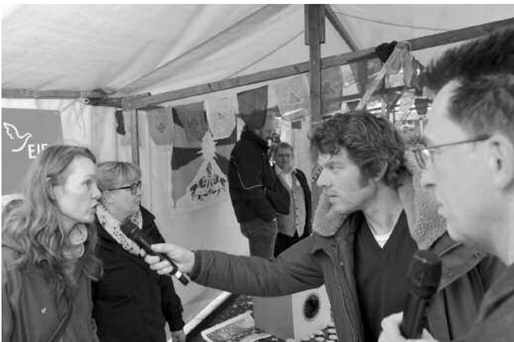
Foto: Schirmherr Steffen Schroeder zu Besuch an den Ständen