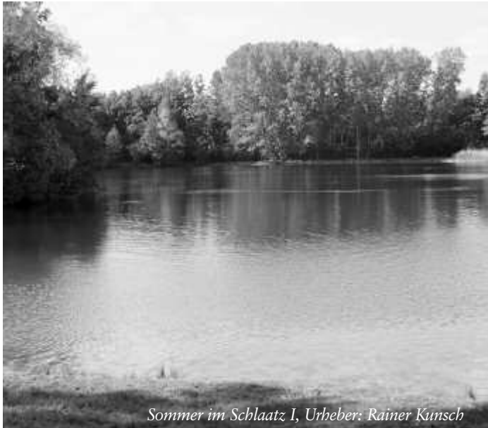
Sommer im Schlaatz I, Urheber: Rainer Kunsch

für ein schöner Ort! Eine gesegnete Sommerzeit wünscht das Team von Kirche im Kiez.